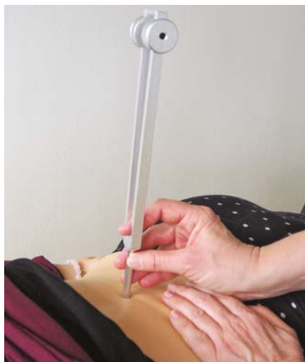
Pôsobenie ladičkou OT 64 Hz na medzistavcové platničky