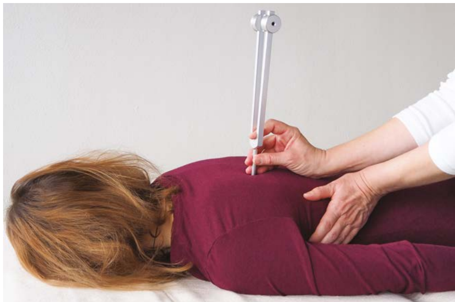
Pôsobenie ladičkou OT 64 HZ na chrbát