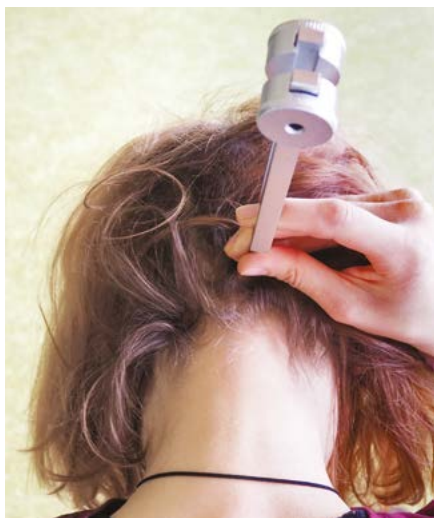
Uvoľnenie krčnej chrbtice ladičkou OT 128 Hz